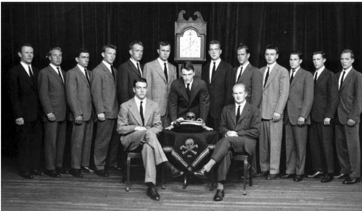
Skull & Bones gemeenschap. Yale Universiteit Connecticut (Links van de klok, George Herbert Bush)